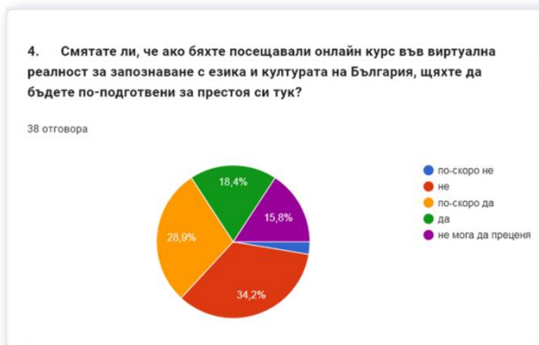
Фиг. 3. АНКЕТА ЧУЖДЕСТРАННИ СТУДЕНТИ. VR технологията като мултилингвистичен инструмент за преодоляване на межкултурните бариери в обучението по чужд език. Въпрос №4.

Съвременните обучаеми са представители на т.нар. Поколение Z, които имат свой специфичен профил и той трябва да се отчита от педагозите, за да бъде ефективен процесът на обучение. Според проучвания сред представители на това поколение самите те се охарактеризират като личности със силно изявена емпатия, приобщаване и действие, определят се също така като страстни защитници на индивидуалността и приобщаването, „по-специално искат да бъдат себе си и настояват светът да приема и приобщава хората, които правят всякакви индивидуални избори“ [6]. От цитираното проучване очакванията на анкетираните към бъдещите педагози са, че преподавателят трябва да осъзнае, че всяко дете учи по свой собствен начин и със свое собствено темпо, както и това, че преподаването трябва да се възприема като нещо повече от това, което се побира в рамките на класната стая и образованието, а съществена част от него са и личните връзки между участниците в образователния процес. Учителят за Поколение Z трябва да се превърне в лидер и това може да стане чрез признаване на различията и чрез изграждане на силна връзка с общността, а едно от най-ценните качества на един лидер е да признава и възприема обучаемия като личност и професионалист. За един такъв „училищен лидер“ ключова стратегия за изграждане е развиването на личността на обучаемите чрез упоритост и висока мотивация с отделяне на необходимото време за индивидуална работа.