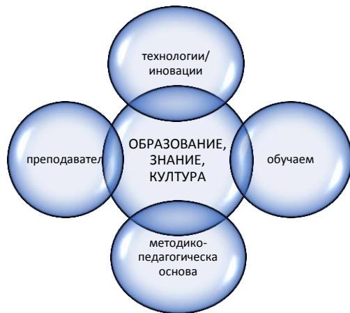
Фиг. 5. Взаимовръзка между основните компоненти на образователния процес, адаптиран спрямо изискванията на реалностите на 21 век.

По-сериозната и отговорна задача е методико-педагогическата, която изисква от преподавателите практики и педагозите теоретици да синхронизират теория и практика чрез проучвания и експериментиране, с прецизиране на теоретичните постановки, след което би следвало да се утвърдят политиките за използването на иновациите в образователна среда.