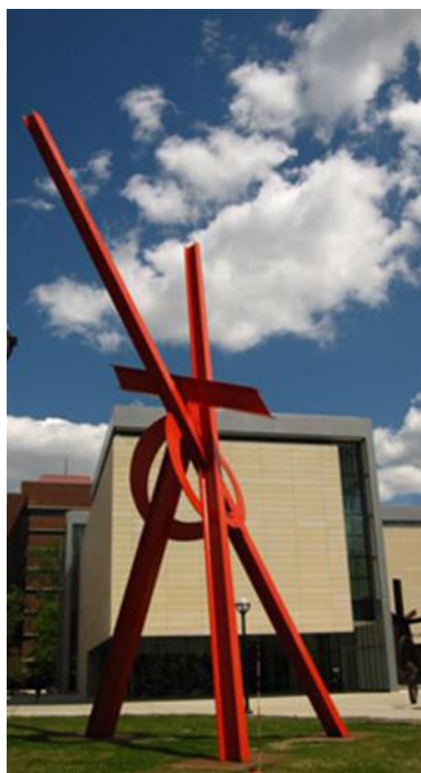
Марк ди Суверо Мичиган Мичигански университет по изкуствата

И естествено в логиката на настоящето са застъпени нови тенденции в желанието да се направят паралелни символни връзки между смисъл и значение. Модерното изкуство се развива към абстрактното, въвеждайки своя собствена символика, за да открие различни гледни точки. Несъмнено това намира израз и в символните пластики и монументи. За Марк ди Суверо формата е експресия и геометрия, а за безспорния Хенри Мур абстракцията е в тясна връзка с природата и средата. Именно в модерността формалните изразни средства дават възможност на различните автори да се изразят по един по-плътен и категоричен начин в който да подчертаят различните си светогледи.