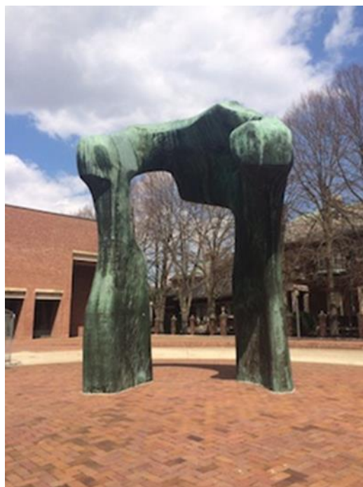
Хенри Мур Стандфордския университет, Калифорния

Този кратък хронологически преглед на различни художествени идеи представя естественото развитие на естетическите концепции на скулптурната форма и нейното интегриране в социалната среда на обществената архитектура. Посочените автори са избрани на случаен принцип и са субективно предпочетени от авторите, за да могат да илюстрират по-ясно посоката на своите търсения в процеса на решаване на поставената им задача.