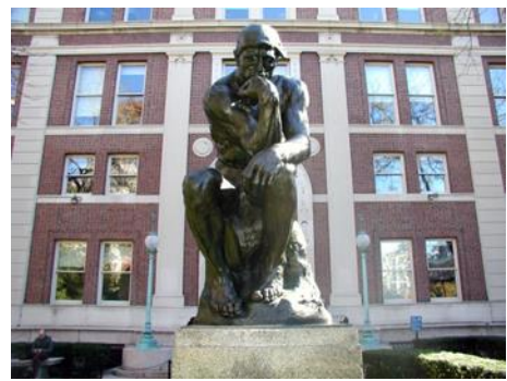
Роден „Мислителят“ Колумбийски университет пред философски факултет