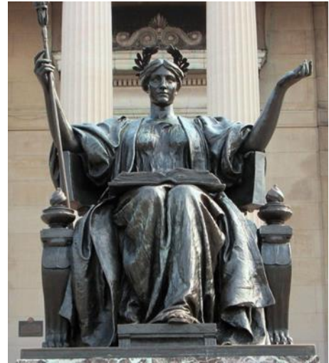
Даниел Френч “Alma Mater” в Колумбийския университет Ню Йорк