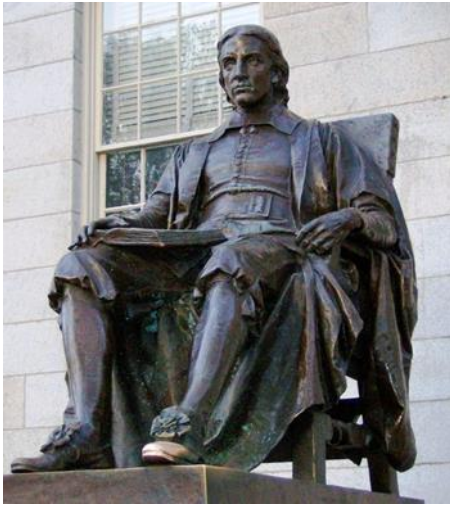
Даниел Френч Джон Харвард (1884), в Харвардския университет, Кеймбридж, Масачузетс

усещането за сигурност и стабилност именно защото се базира на образци доказали се и влезли в историята като класически.