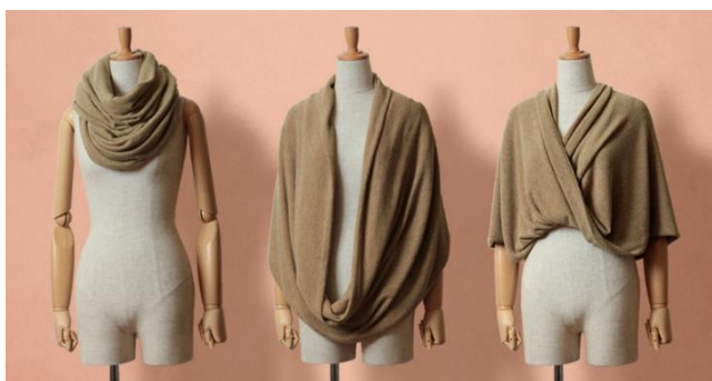
б) Трансформируем шал за бременни на Sweet Mommy