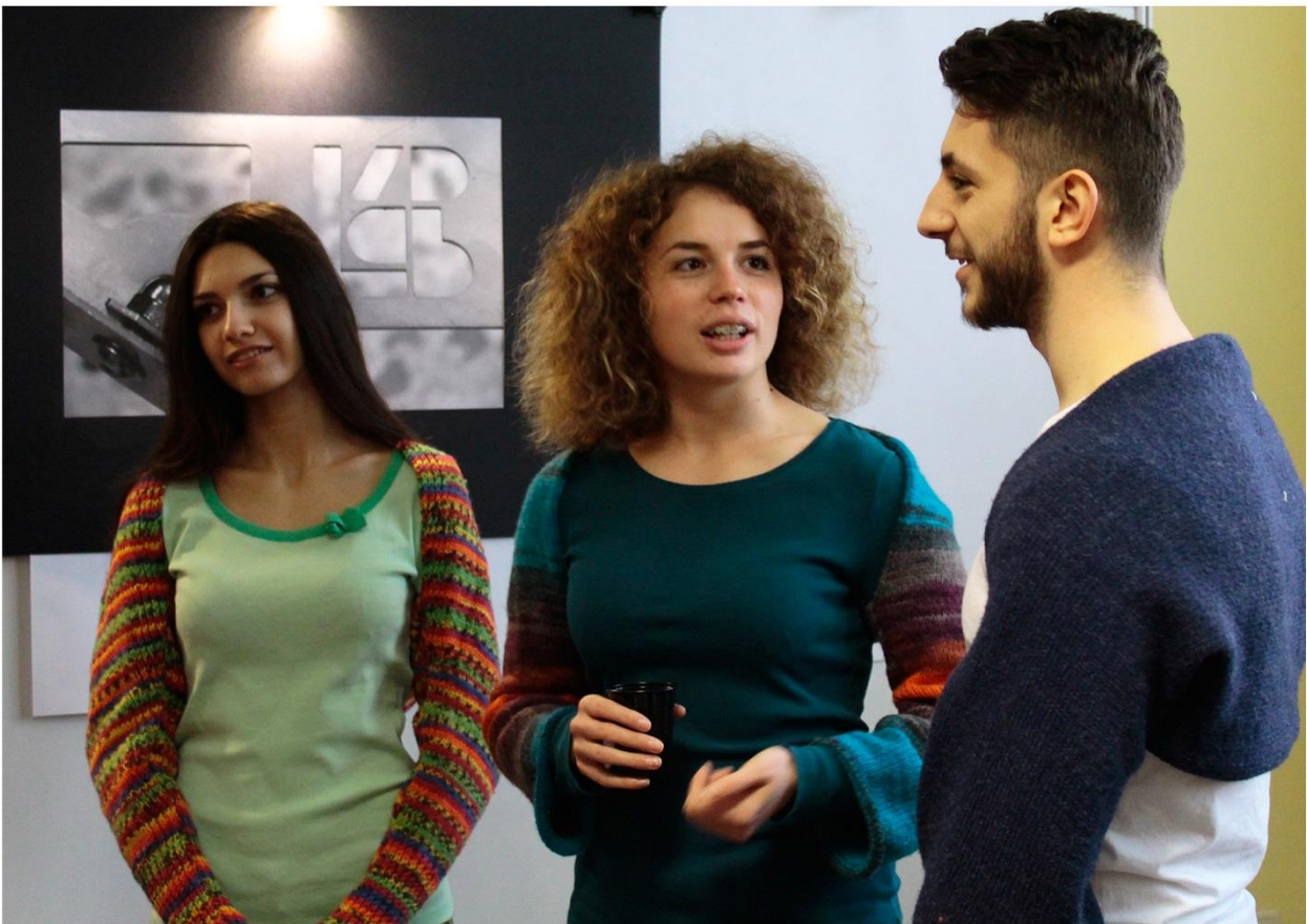
фиг. 2 – Шал с ръкави - носимо устройство Scarfey O'Shrug