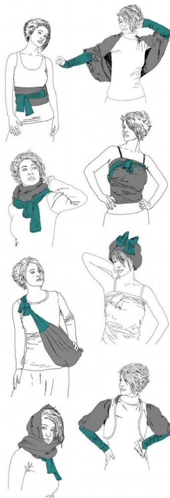
с) Трансформируем шал на SHIMOSH