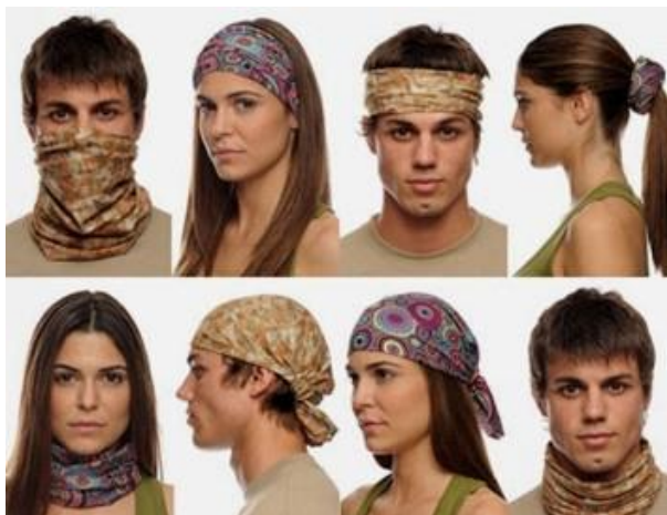
а) Как се носи бѣф