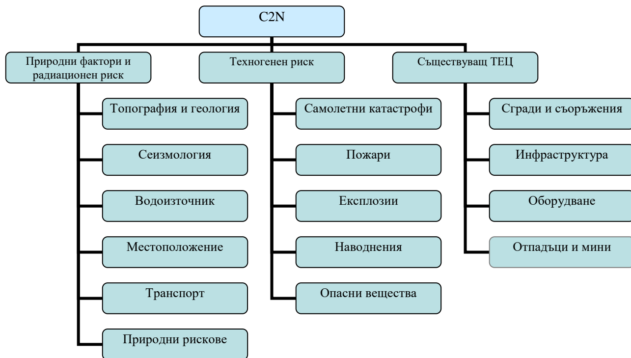
Фиг. 1. Критерии за предварителна оценка

централи са дадени групите характеристики, които се разглеждат при избор на площадка, както и условията, при които на дадена площадка не може да се изгради ЯЕЦ, а Наредбата за аварийно планиране и аварийна готовност при ядрена и радиационна авария постановява зоните за превантивни и неотложни защитни мерки и забраните за разполагане на жилищни сгради, промишлени предприятия, допускане на хора и т.н. в зоната за превантивни защитни мерки, която е с радиус приблизително 2 км. около ЯЕЦ. Законодателните изисквания и факторите, влияещи при С2N [11] са обобщени във Фиг. 1, давайки критерии за предварителна оценка за пригодността за разполагане на ЯЕЦ на площадки, заемани от ВТЕЦ, в Р. България.